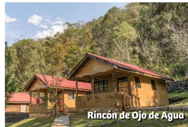
Rincón de Ojo de Agua