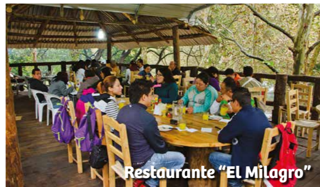
Restaurante "El Milagro"