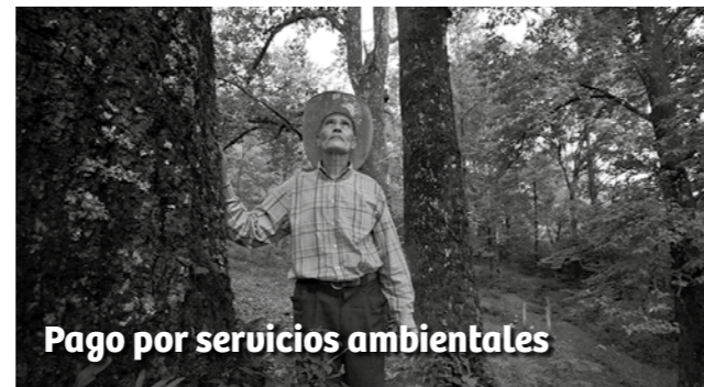
Pago por servicios ambientales