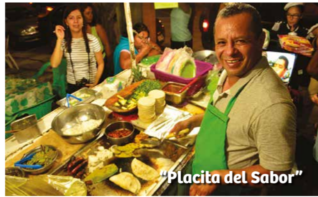
"Placita del Sabor"