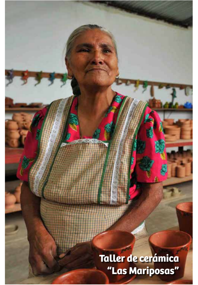
Taller de cerámica "Las Mariposas"