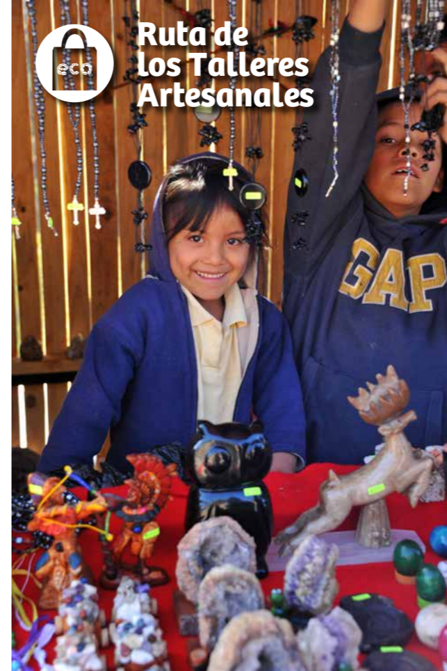
Ruta de los Talleres Artesanales

Así, se abren nuevas opciones para fortalecer la economía de la conservación, que junto con los pagos por los servicios de sus bosques a los propietarios suman un importante ingreso a los bolsillos serranos. Así, los beneficiarios se han involucrado en este manejo innovador generando valor económico alrededor de opciones de desarrollo con y para la Naturaleza.