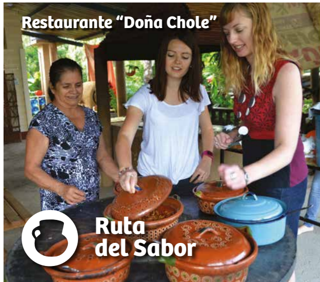
Restaurante "Doña Chole"