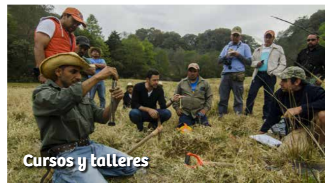
Cursos y talleres