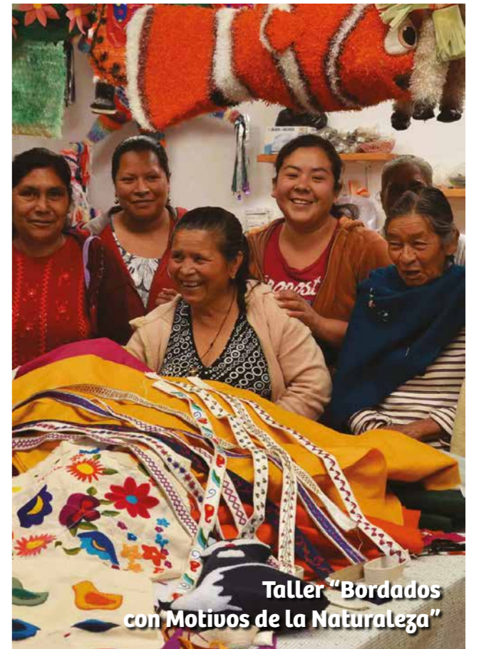
Taller "Bordados con Motivos de la Naturaleza"