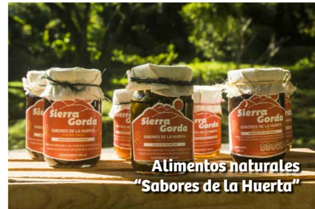
Alimentos naturales "Sabores de la Huerta"