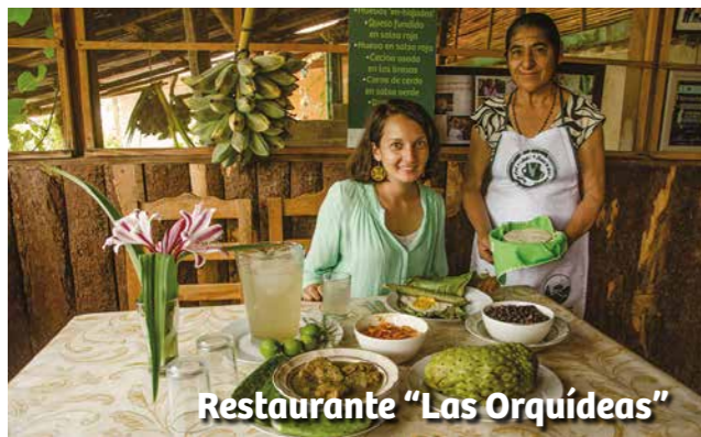
Restaurante "Las Orquídeas"

La tradicional cecina en las brasas, licores digestivos, platillos a base de flores de temporada y hongos, no pueden faltar en tu visita a la región. Pregunta por los platillos de temporada y haz de la gastronomía serrana un motivo de visita.