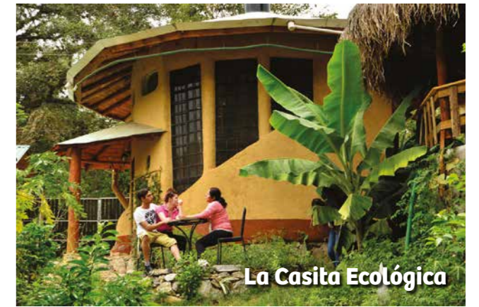
La Casita Ecológica