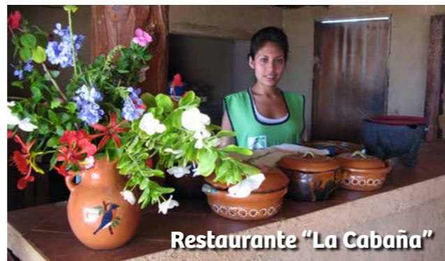
Restaurante "La Cabaña"