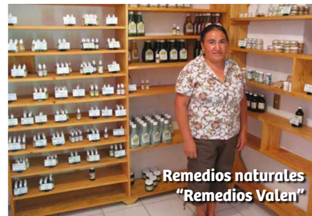
Remedios naturales "Remedios Valen"