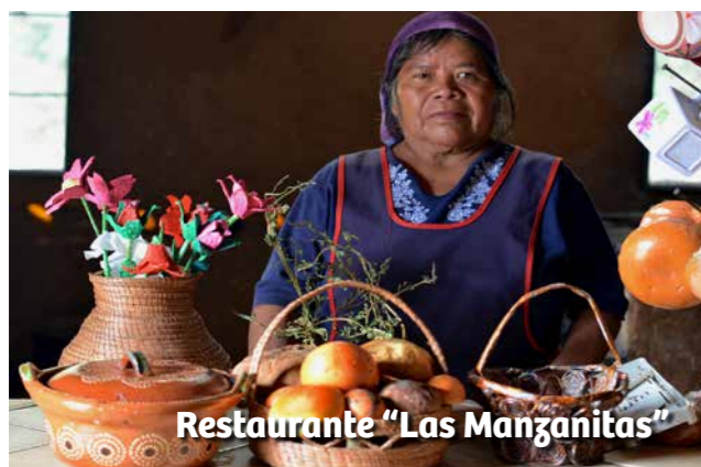
Restaurante "Las Manganitas"