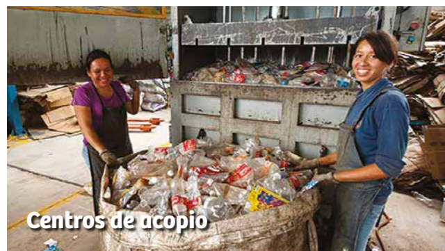
Centros de acopio